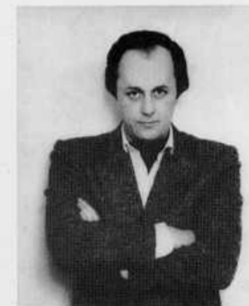
РОССИЙСКИЙ ГОСУДАРСТВЕННЫЙ СИМФОНИЧЕСКИЙ ОРКЕСТР "МОЛОДАЯ РОССИЯ" Художественный руководитель и главный дирижер МАРК ГОРЕНШТЕЙН

Российский государственный симфонический оркестр "Молодая Россия" был создан в 1990 году указом Правительства Российской Федерации. Учредителем оркестра является Министерство культуры РФ.