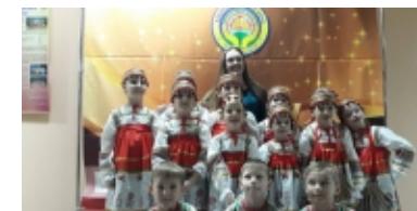
"Наследие" Золотухинского района

В 1993 окончил Казанскую консерваторию по классу фортепиано, дебютировал как джазовый пианист с сольной программой на казанском фестивале «Джазовый перекресток». В 1993 получил специальный приз Польской джазовой академии на конкурсе «Джазовые юниоры» в Кракове. Участвовал во многих российских фестивалях, в 1997 получил 2-ю премию на конкурсе Pianello val Tidone (Италия), в 1998 был продюсером саратовского джазового фестиваля. В 2000 году вместе с трио переехал в Москву.