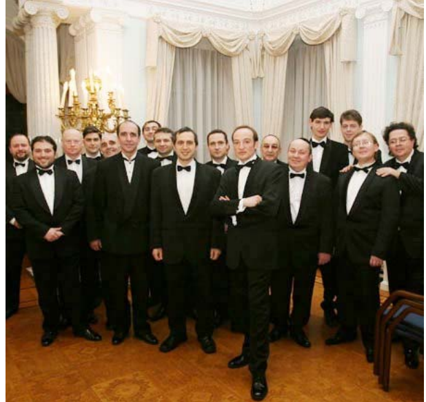
Хор "Хасидская капелла"